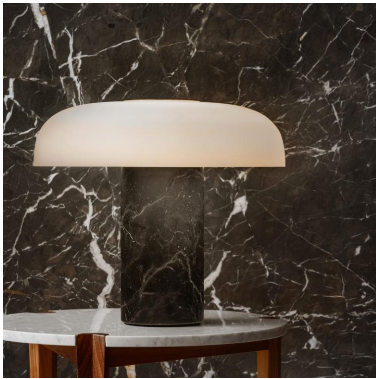
TROPICO TAVOLO MEDIA NERA, F442105585NEWL